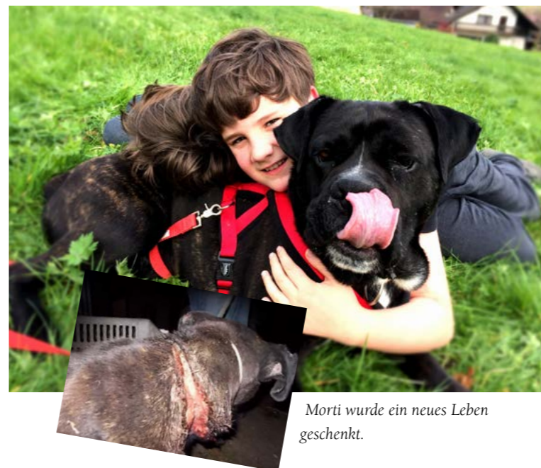
Morti wurde ein neues Leben geschenkt.