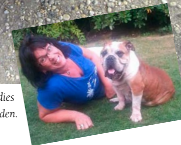
Boszko im Paradies auf Erden.